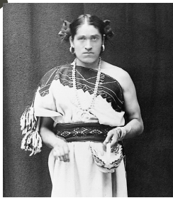
We-wha, un lhamana de la tribu Zuni (b. 1849)

Lo que significa ser un "niño" o una "niña" está determinado por la cultura y ha cambiado con el tiempo; no está prescrito por la anatomía. Por ejemplo, en el siglo XIX Los niños Estadounidenses usaban vestidos de encaje y cabello largo. En muchas culturas indígenas existe un tercer género ; a veces los llaman personas de "dos espíritus". Los individuos de este género a menudo son líderes espirituales venerados en sus comunidades.